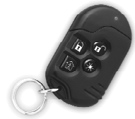
Figuur 1. E99104

Code Secure ontvangers zijn ontworpen om deze melding te identificeren en dan de corresponderende uitgang aan te sturen. Elke zender is uitgerust met een kleine sleutelhanger.